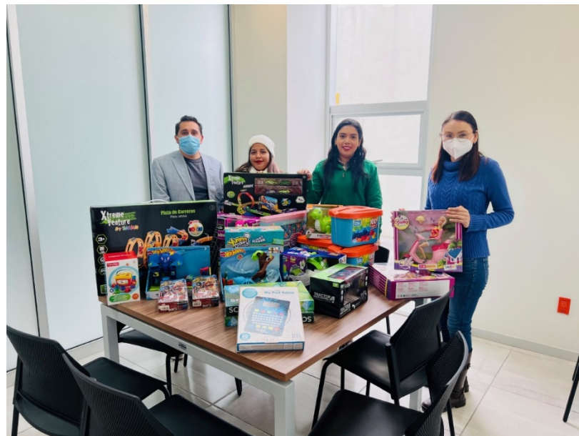
Entrega de juguetes de donación por parte del Sindicato Estatal de Trabajadores al Servicio del Poder Judicial.