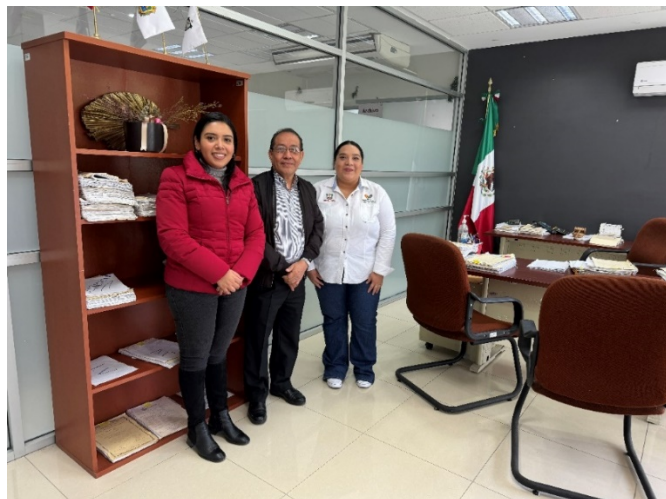
Entrevista con autoridades judiciales.