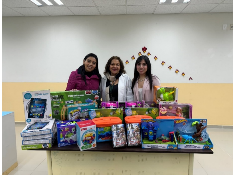
Entrega de juguetes de donación por parte del Sindicato Estatal de Trabajadores al Servicio del Poder Judicial.