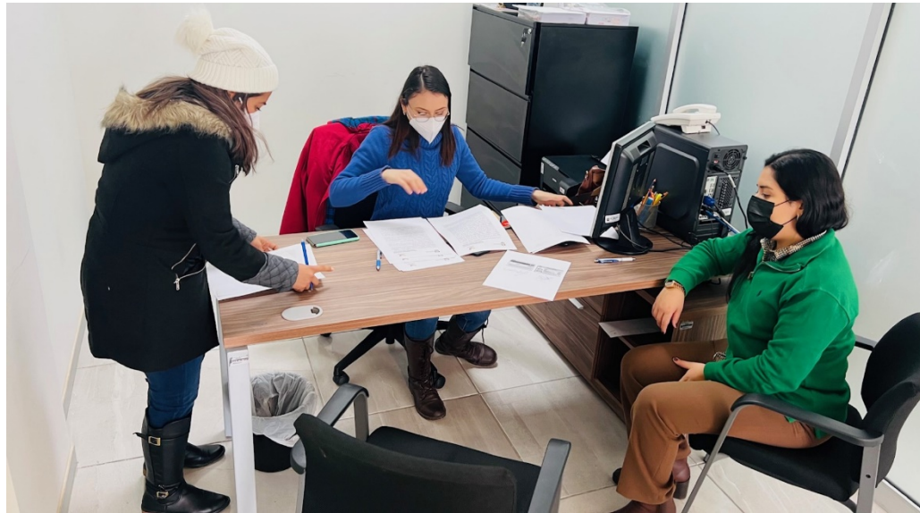
Firma de acta circunstanciada, levantada en cada visita realizada.