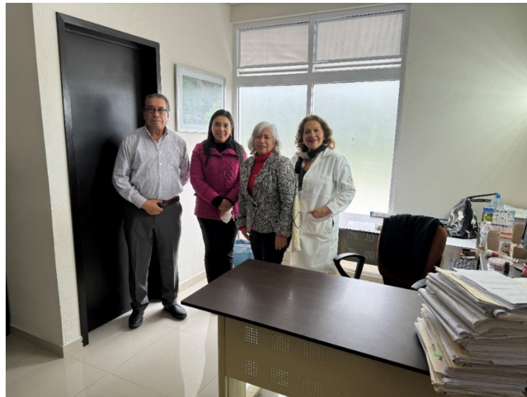
Entrevista con autoridades judiciales.