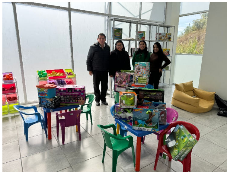
Entrega de juguetes de donación por parte del Sindicato Estatal de Trabajadores al Servicio del Poder Judicial.