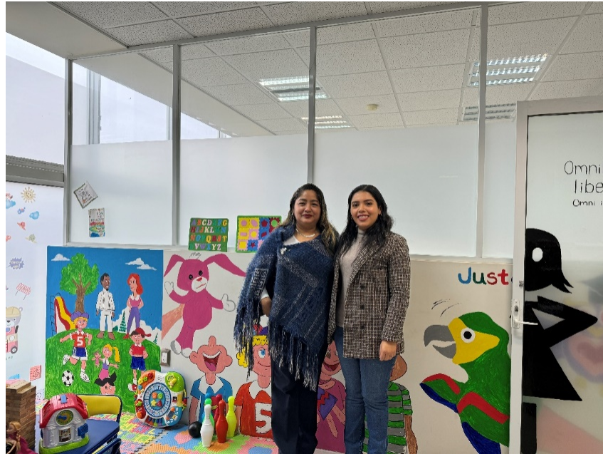
Entrevista con autoridades judiciales.