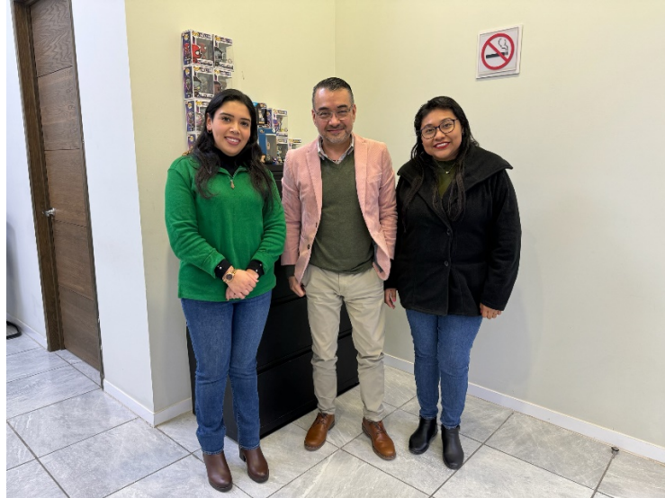
Entrevista con autoridades judiciales.