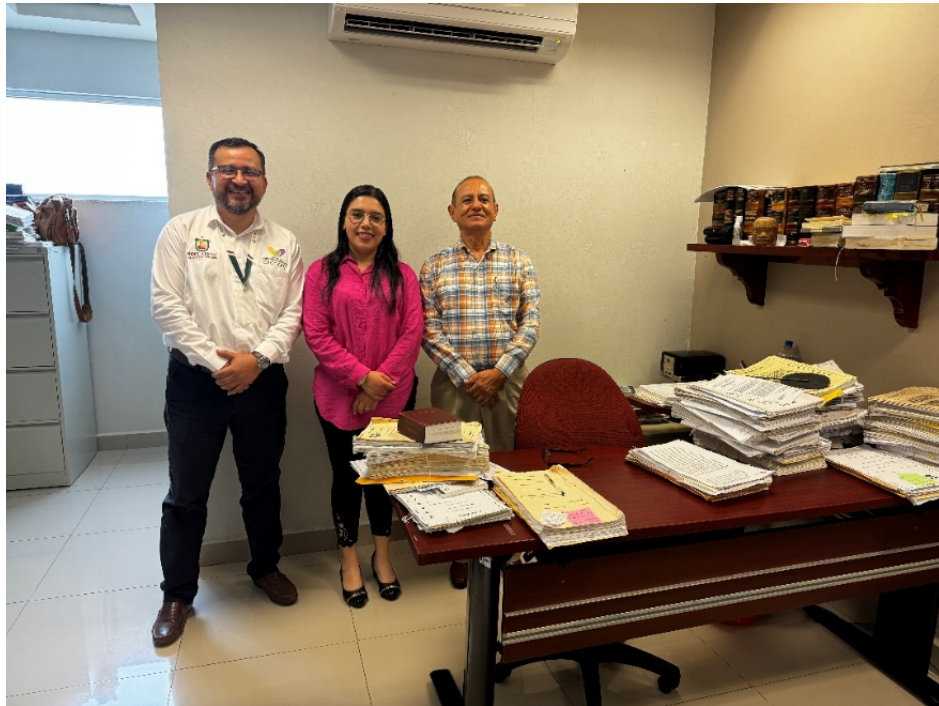
Entrevista con autoridades judiciales.