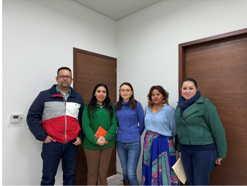
Entrevista con autoridades judiciales.