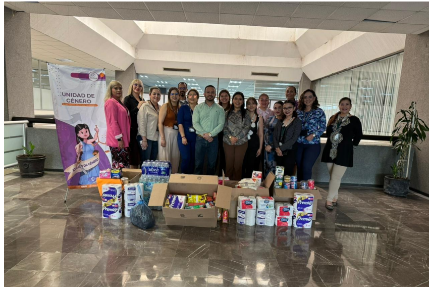
Entrega de los víveres recolectados en el área de la Unidad de Género del Poder Judicial del Estado.