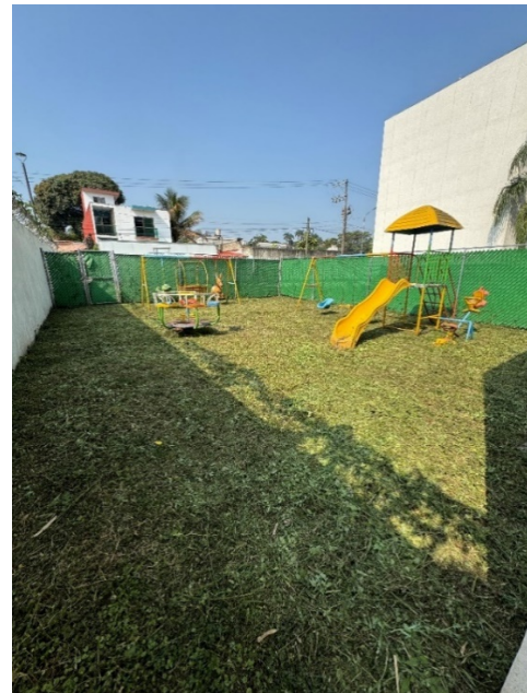
Recorrido en las instalaciones del Centro.